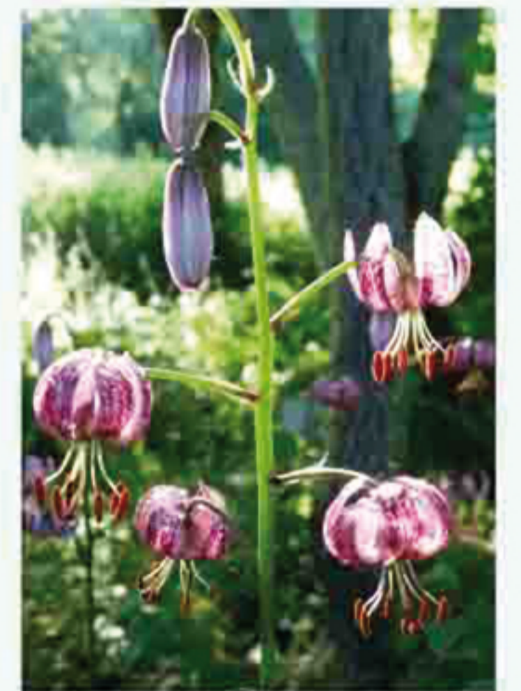
Les trientagon au jardin botanique.