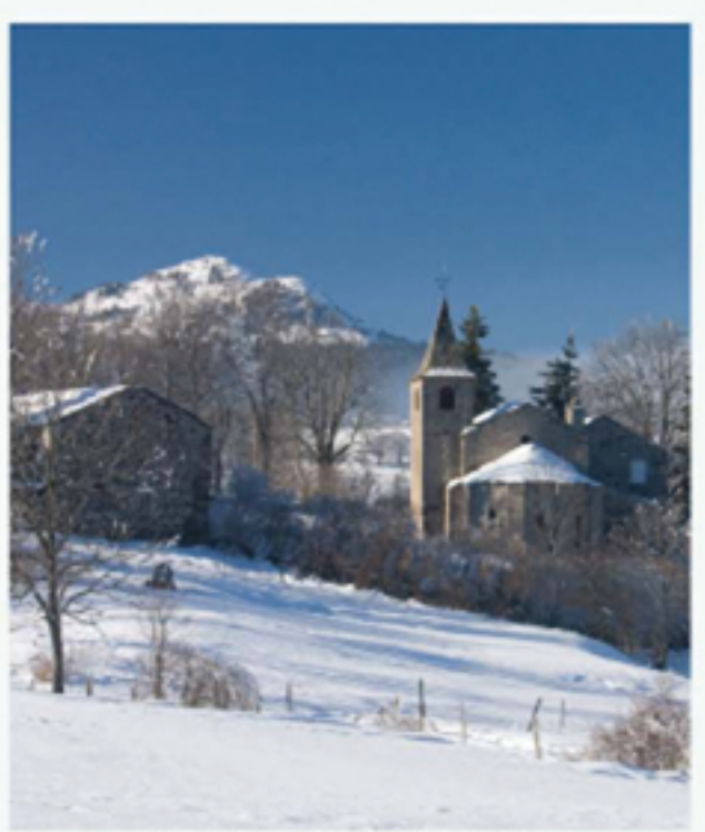
Eglise de Saint-Voy et Pic du Lizieux.