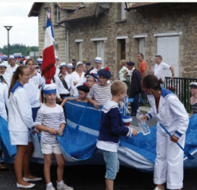
Bleu blanc rouge.