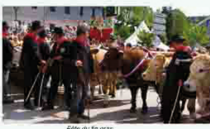
Fête du lin gras