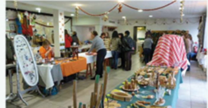
Marché de Noël.