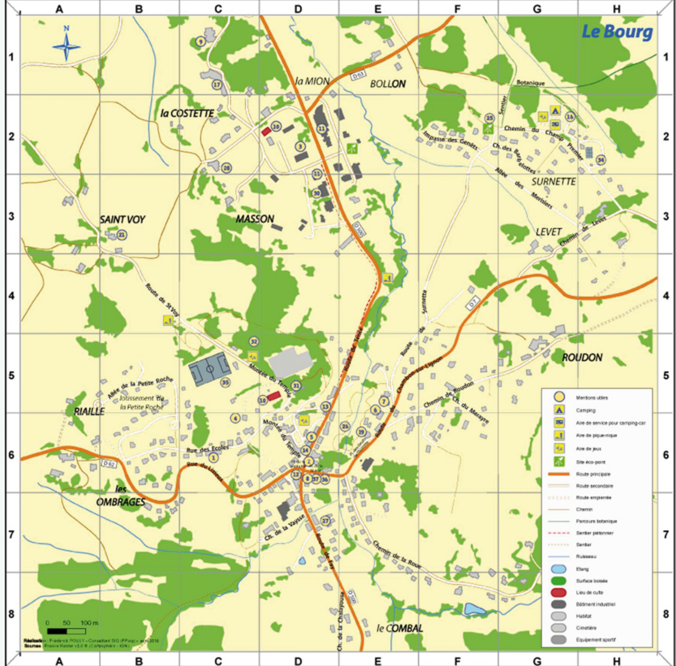
Création et réalisation : Imp. ROUX 04 71 59 80 85 - Dépôt légal juillet 2016