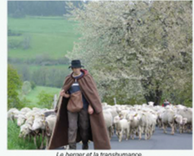
Le berger et la transhumance.