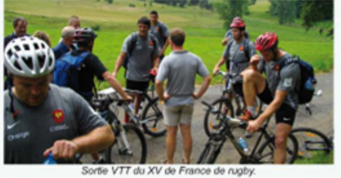
Sortie VTT du XV de France de rugby.