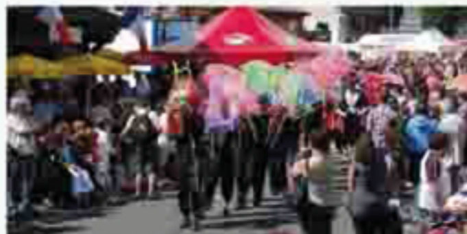
Fête du terroir