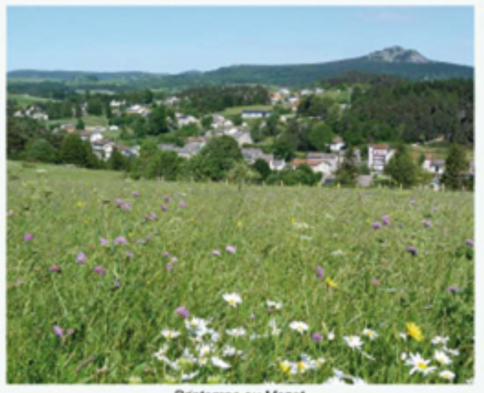
Printemps au Mazet.