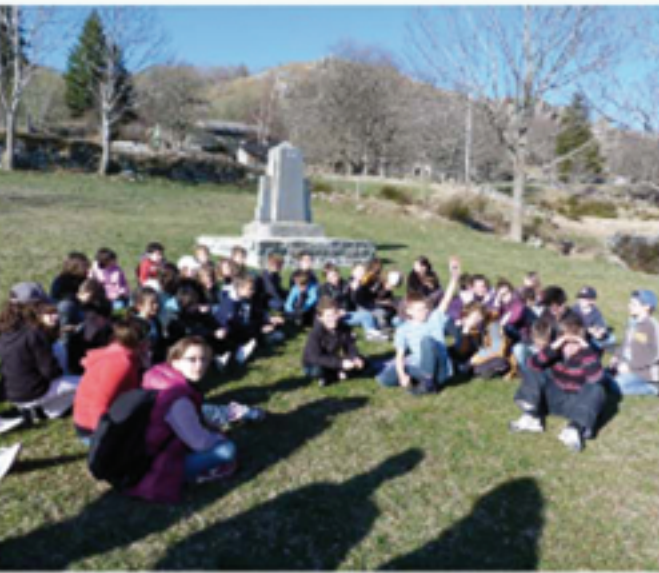
Voyage scolaire : accueil et résistance.