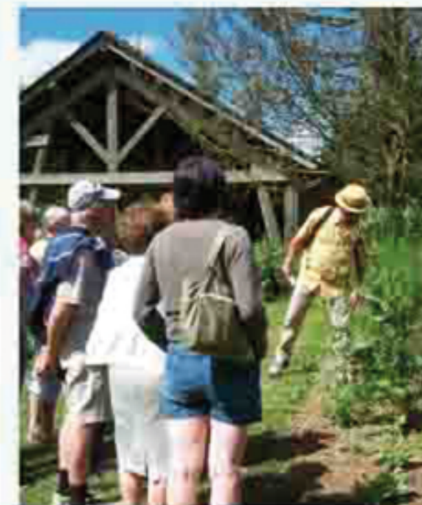
Visite guidée au jardin botanique ; de la plante à l'assiette.

La CCHL à votre service, pour vos démarches, contactez : Siège administratif : 13 rue des écoles à Tenace ..... 04 71 59 87 43 Bureau intercommunal ..... 04 71 65 00 11 (du 1 er novembre au 30 avril) Centre de loisirs intercommunal de Haut-Lignon ..... 04 71 65 45 09 École de Musique intercommunale de Haut-Lignon ..... 06 84 08 88 12 Ludothèque ..... 04 71 59 59 13 Maison des Breuils ..... 04 71 56 12 49 Portage de repas à domicile ..... 04 75 30 29 37 Relais Petite Enfance ..... 04 71 59 81 72 ou 06 74 52 75 34 Massage seniors ..... 04 71 59 87 43 Service Public d'Assainissement Non Collectif (SPANC) ..... 04 71 02 12 13 Syndicat de Gestion des Eaux du Volay