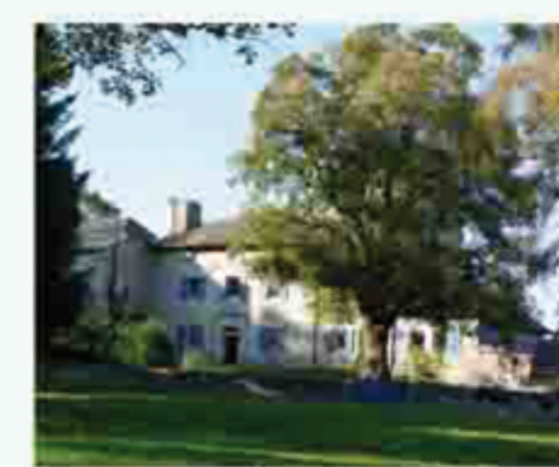
Panoramic view of a village.

LE MAZET SAINT-VOY Altitude : 1000 m - Population : 1162 habitants Habité dès la préhistoire comme en témoignent divers vestiges (dolmens, menhirs, pierre à cuvette), la commune, dominée par la ligne volcanique bleue du Lizieux, marquée par la culture réformée au XVI ème siècle, resta un des hauts lieux du protestantisme. Le Mazet Saint-Voy a su évoluer, réhabilitant son centre bourg qui possède les services essentiels, revitalisant ses commerces par l'impulsion d'une activité artisanale dynamique. De nombreuses manifestations se déroulent tout au long de la saison touristique (foire du terroir le 1 er week-end d'août, expositions, sorties découvertes, concerts, conférences, ...). Vous pourrez aussi pratiquer le tennis, la boule lyonnaise, la pêche en lac ou en rivière dans un cadre naturel préservé. Au fil de vos balades, vous découvrirez des sites remarquables : la halle fermière, le jardin botanique, l'église de Saint-Voy, la maison forte de Panelier où séjourna Albert Camus, les moulins du Bouchat, le Pic du Lizieux culminant à 1388 m. Nombreuses possibilités d'accueil (centre de vacances, gîtes, meublés, chambres d'hôtes, ...) au cœur de charmants villages traditionnels aux remarquables toitures de lauzes.