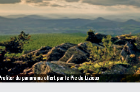
2 Profiter du panorama offert par le Pic du Lizieux