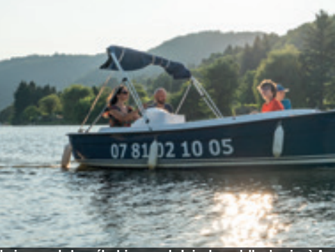
3 Naviguer en bateau électrique sur la Loire lorsqu'elle s'apaise à Auréc