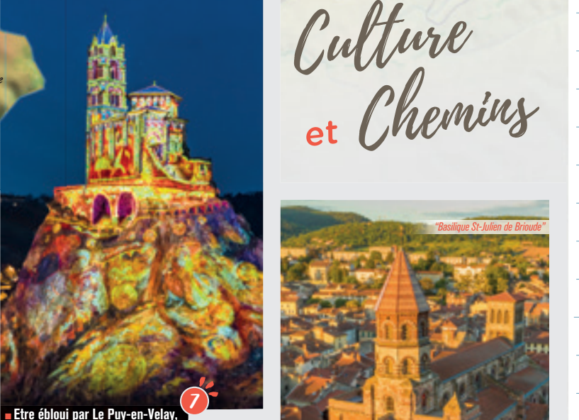
7 Être ébloui par le Puy-en-Velay, haut lieu du spectacle numérique, capitale européenne des Chemins de Saint-Jacques-de-Compostelle, Patrimoine Mondial de l'Unesco